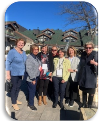
Déléguées et substituts Congrès 2026