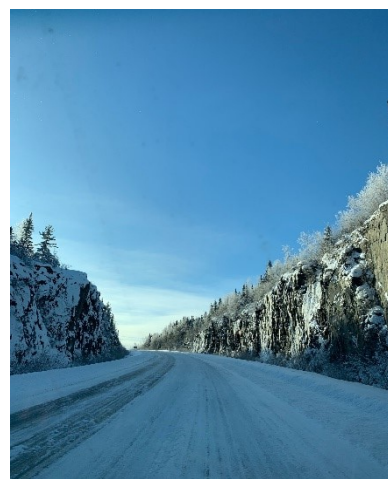
Photos prises sur la Route Billy-Diamond (Baie-James) 2024-12-24